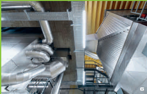
6 Die Kondensationsanlage